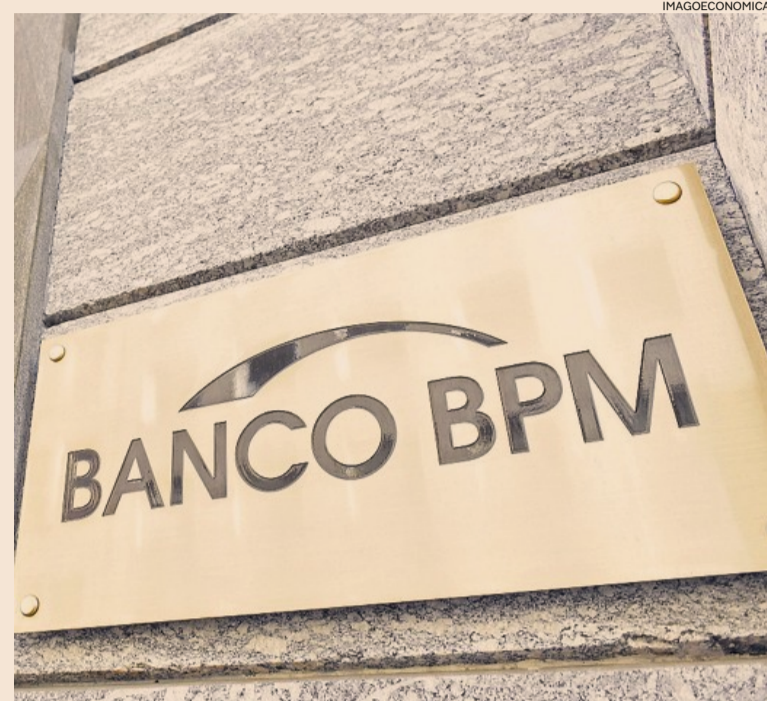
Ex popolare. Il cda di BancoBpm al primo rinnovo dopo la fusione